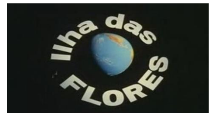
L'île aux fleurs - Jorge FURTADO